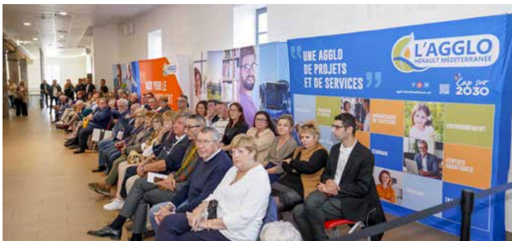
Le public est venu assister en nombre à cette séance d'installation des élus.