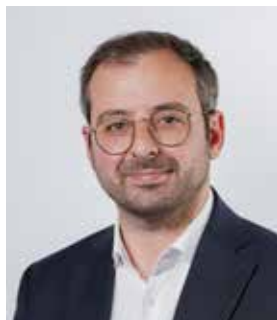
Aurélien LOPEZ-LIGUORI 1 er vice-président délégué au développement économique et au numérique Maire d'Agde