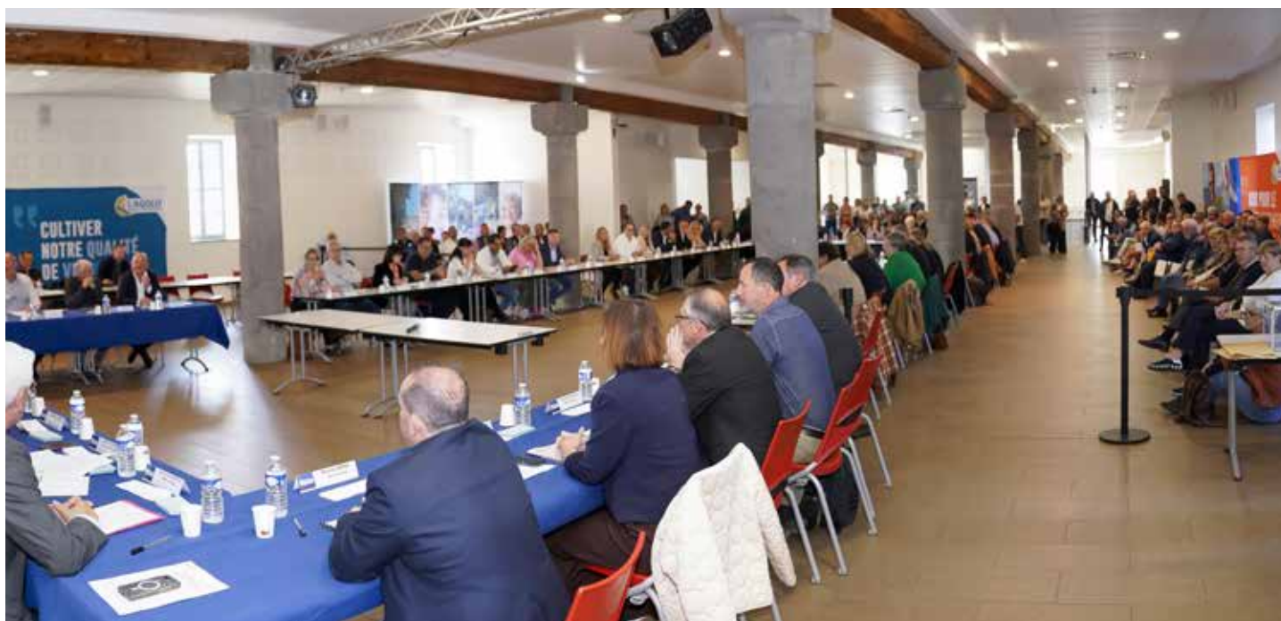
Les 58 élus communautaires réunis pour élire les membres du bureau

La nouvelle mandature s'ouvre ainsi sous le signe d'une gouvernance apaisée, exigeante et résolument tournée vers l'avenir, pour que chacun, où qu'il vive sur le territoire, puisse bénéficier pleinement de l'action intercommunale.